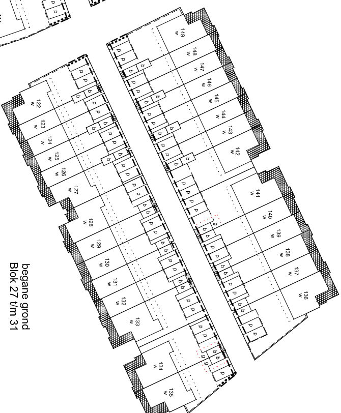
begane grond Blok 27 t/m 31

Legenda Complex Noorderduin Fase 4 (deelplan 3)