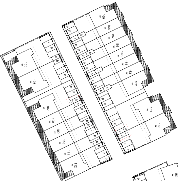
begane grond Blok 22/23 en Blok 35/36